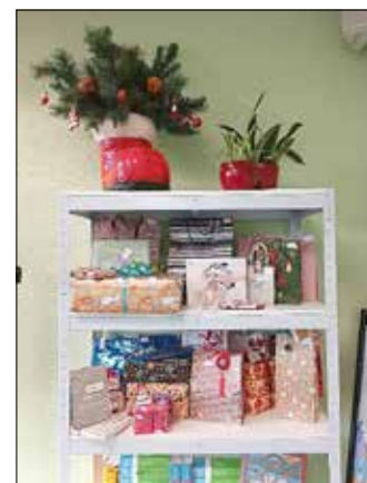
Wichtel-Adventskalender in Klasse 7

Klasse 8 hatte direkt am Anfang der Adventszeit einen etwas anderen Unterrichtstag und besuchte den Bürgermeisters Herrn Nowotny im Rathaus. Sie haben dort herausgefunden, welche Aufgaben und Pflichten ein Bürgermeister hat. Er erläuterte die Besonderheiten der Gemeinde Königswartha und machte auch auf Probleme der regionalen Kommunalpolitik aufmerksam. Vielen Dank, dass wir zu Besuch kommen durften.