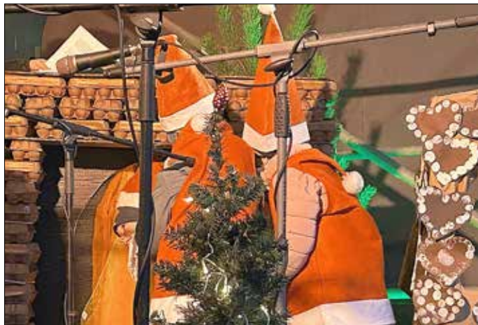
Die Kinder und Erzieherinnen der Grashummelgruppe

und auch die Aufregung wurde größer. Und dann war es soweit: Am 7. Dezember 2024 trafen sich die Kinder vor der großen Bühne und brachten reichlich Lampenfieber mit. Tapfer ging es dann auf die Bühne und voller Stolz zeigten alle in einem 30-minütigen Programm was in den letzten Wochen geprobt wurde. Es gab zwar ein paar technische Schwierigkeiten aber davon haben sich die Kinder nicht beirren lassen und auch ohne Mikrofon ihren erlernten Text gesprochen und gesungen. Toll gemacht und der Applaus war mehr als verdient. Ein ganz besonders großes Lob bekamen die Kinder auch von der ehemaligen Kita-Leitung sowie von den ehemaligen Erzieherinnen. Das hat uns sehr gefreut.