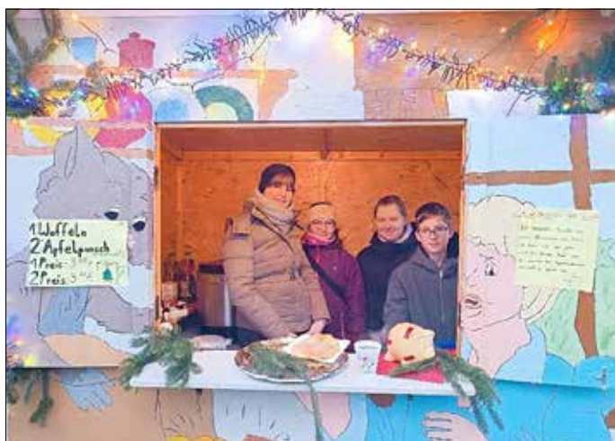
Waffelbäcker aus Klasse 7

Zum Jahresabschluss begrüßten wir das Sorbische Nationalensemble in unserer Schule. Da dieses Mal Teile des Orchesters am Konzert beteiligt waren, sogar ein Cembalo, durften wir dem Konzert in der Turnhalle lauschen. Neben Gästen aus dem Pflegeheim besuchten auch Königswarthaerinnen und Königswarthaer das Konzert.